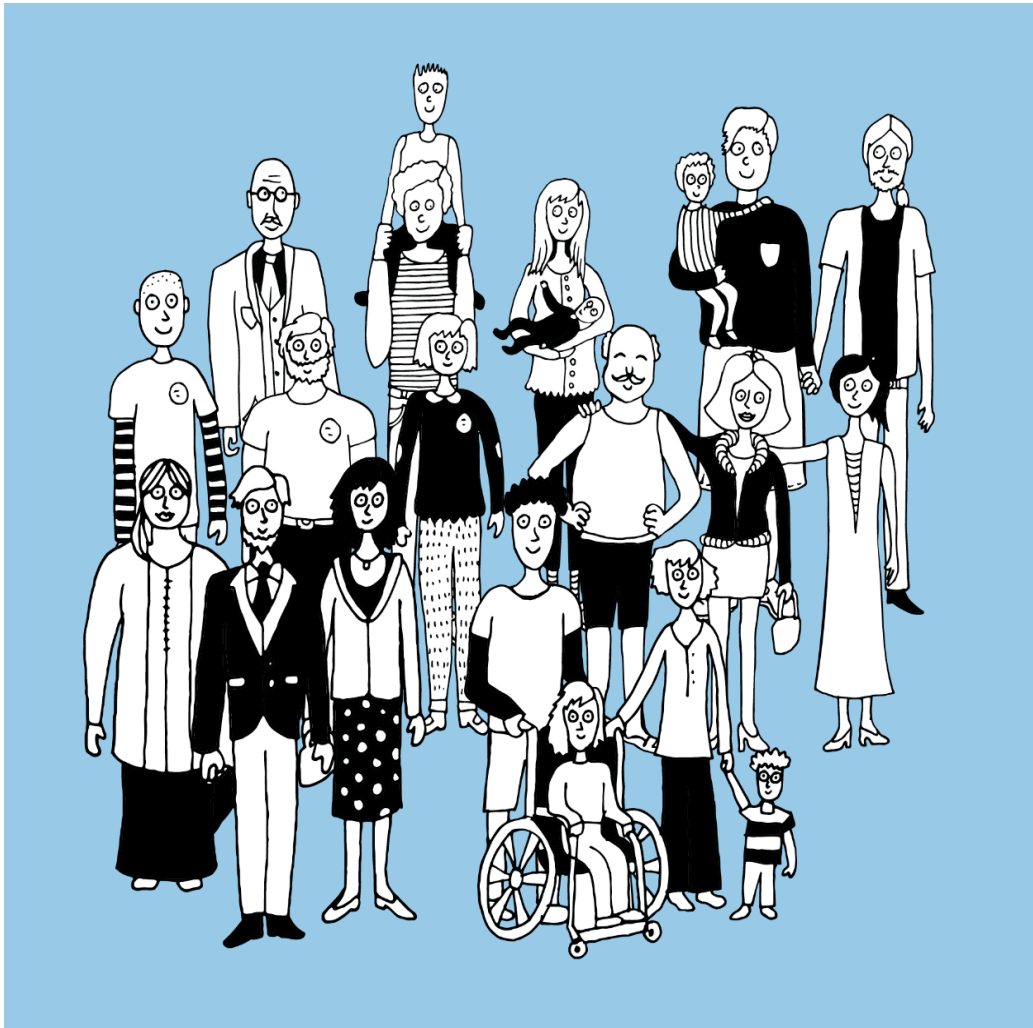
Illustrations : Plates-Bandes communication